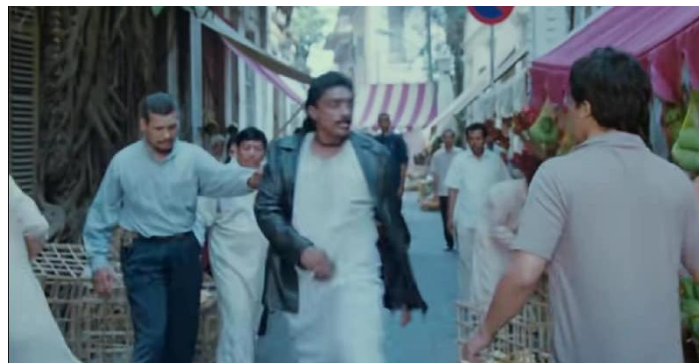
Gambar 4 Adegan di pasar tradisional

Latar belakang visual berupa bangunan bersejarah, pasar tradisional ( souq ) Arab memperkuat citra Mesir sebagai peradaban Islam yang kaya dan berusia panjang (Mudjiono, 2011).