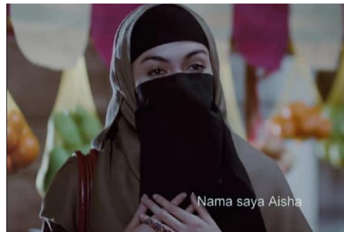
Gambar 4 Adegan di pasar tradisional

Secara visual, perempuan Arab dalam film ini hampir seluruhnya ditampilkan dengan penutup wajah (cadar/niqab) atau hijab penuh.