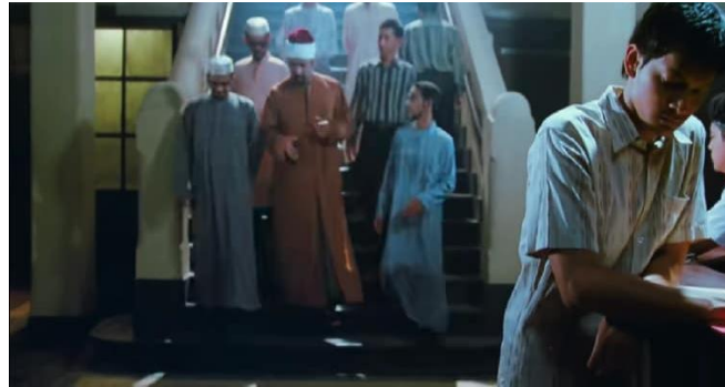
Gambar 3 Adegan Syekh berbincang dengan mahasiswa

Secara visual, identitas kebudayaan direpresentasikan melalui kostum dan arsitektur. Tokoh-tokoh Mesir digambarkan mengenakan pakaian tradisional (jubah, galabiyya , dan penutup kepala) yang secara konsisten membedakan mereka dari tokoh Indonesia.