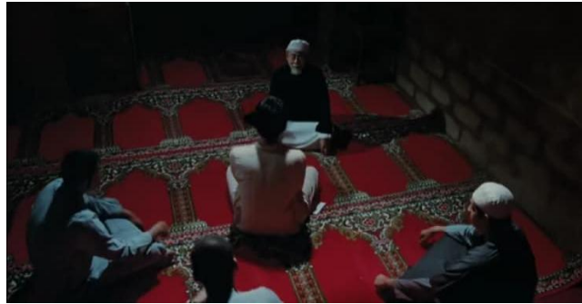
Gambar 2 Adegan Talaqqi bersama Syekh

teman-temannya saat ber- talaqqi (membaca Al-Qur'an di hadapan Syekh ) sebagai salah satu ciri khas pembelajaran di Universitas Al-Azhar (Panigoro et al., 2022) yang berada di sebuah ruangan yang digambarkan sebagai salah satu ruangan di Masjid Universitas Al-Azhar.