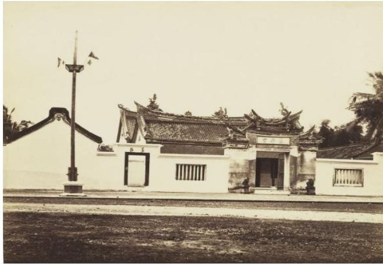
Gambar 4. Klenteng Cu An Kiong [Before 1880]