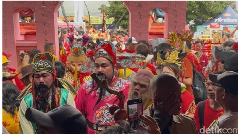
Gambar 15. Pawai KongCo-MakCo di Kompleks Kelenteng Cu An Kiong Lasem, Rembang, Minggu (20/4/2025).