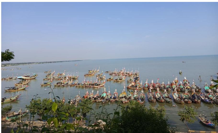
Gambar 1. Pelabuhan Teluk Regol Sekarang 28 Juni 2025

Keberadaan pantai dan akses laut menjadikan Lasem bagian dari jalur pantai utara (Pantura), sehingga secara historis berfungsi sebagai titik persinggahan kapal dagang dan pelabuhan. Sebagai kota bandar di era perdagangan rempah-rempah dan perdagangan maritim, Lasem menarik pedagang, pelaut, dan pendatang dari berbagai daerah termasuk dari luar Jawa. Akses laut dan jalur darat memfasilitasi arus manusia dan barang, serta memungkinkan terjadinya kontak budaya dari berbagai etnis dan latar belakang. Hal ini menjadi modal penting bagi terbentuknya masyarakat plural di Lasem.