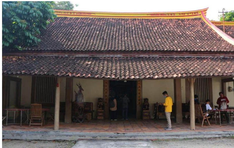
Gambar 11. Rumah Bekas Penyelundupan Candu, tampak depan

ciri khas seperti gapura berpintu kayu, lantai terakota, tiang kayu, serta atap berbentuk ekor walet. Di bagian dalam terdapat lorong rahasia yang dahulu digunakan untuk menyelundupkan candu pada masa kolonial. Rumah ini dikenal sebagai bekas rumah candu karena pada abad ke-19. Letaknya yang dekat dengan Sungai Lasem diduga mendukung aktivitas penyelundupan melalui jalur bawah tanah yang terhubung dengan sungai. Di bagian belakang bangunan juga terdapat makam Tionghoa yang diperkirakan merupakan makam Lim Cui Bun bertahun 1827.