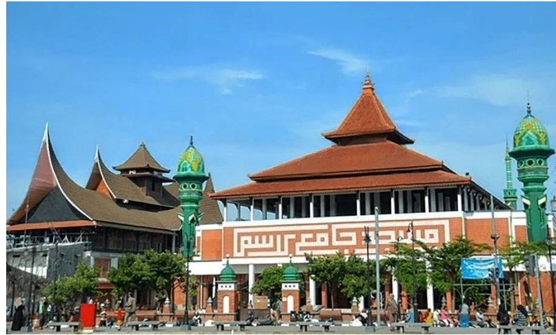
Gambar 13. Masjid Jami' Lasem sekarang