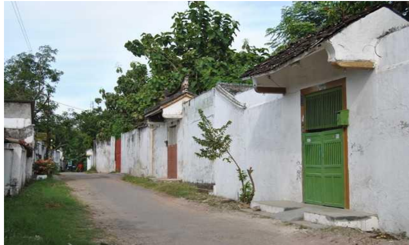
Gambar 3. Pemukiman Pecinan di Lasem

Pada tahun 1740 terjadi peristiwa pembantaian besar terhadap etnis Tionghoa di Angke, Batavia, yang dilakukan oleh VOC bersama kelompok masyarakat tertentu. Kerusakan dan penjarahan yang berlangsung pada 22 Oktober 1740 tersebut menyebabkan ribuan warga Tionghoa meninggal dunia, sementara hanya sebagian kecil yang berhasil menyelamatkan diri. Para penyintas kemudian melarikan diri ke berbagai wilayah di pesisir utara Jawa, termasuk Lasem. Setelah tragedi tersebut, jumlah masyarakat Tionghoa di Lasem semakin meningkat dan membentuk kawasan permukiman baru di sekitar Babagan hingga Desa Soditan. Mereka juga mendirikan rumah-rumah bergaya arsitektur Tionghoa, kelenteng salah satunya klenteng Cu An Kiong banyak yang menyebut sebagai kelenteng tertua di Jawa yang kemudian menjadi salah satu ciri khas budaya Lasem.