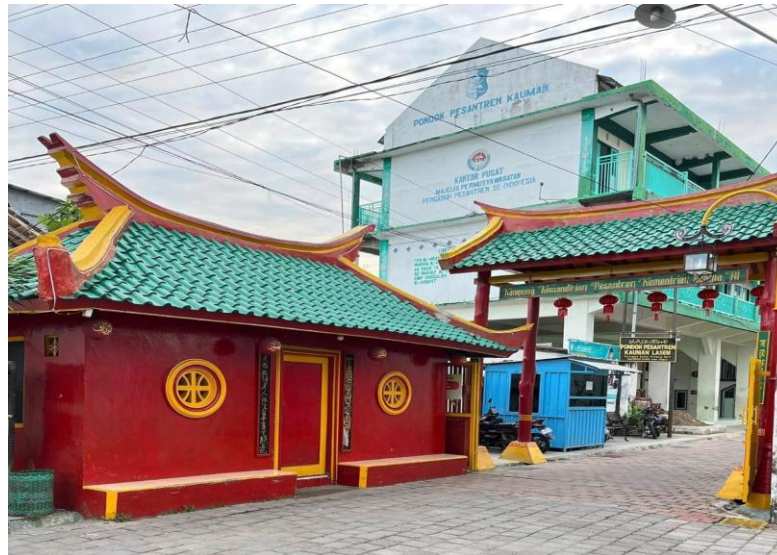
Gambar 6. Ponpes Kauman di Kauman Desa Karangturi, Lasem, Rembang