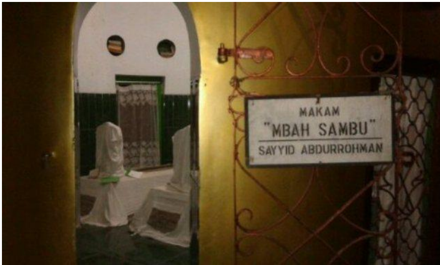
Gambar 5. Masjid Jami' Lasem sekarang