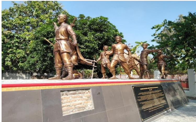
Gambar 9. Monumen tentang Tumenggung Widyaningrat, Raden Panji Margono, Kiai Ali Baidlawi, dan yang lainnya yang sedang melawan VOC.

Pembantaian Angke oleh VOC di Batavia pada tahun 1740. Penindasan keji tersebut memaksa ribuan warga Tionghoa melarikan diri ke berbagai daerah, termasuk Lasem, di mana mereka mulai beradaptasi dengan budaya lokal melalui penggunaan identitas Jawa hingga memeluk agama Islam. Alih-alih memecah belah, kekejaman kolonial Belanda ini justru menjadi pemantik trauma bersama yang melahirkan solidaritas antaretnis yang kuat antara masyarakat Tionghoa dan pribumi guna membangun kekuatan perlawanan baru di wilayah tersebut.