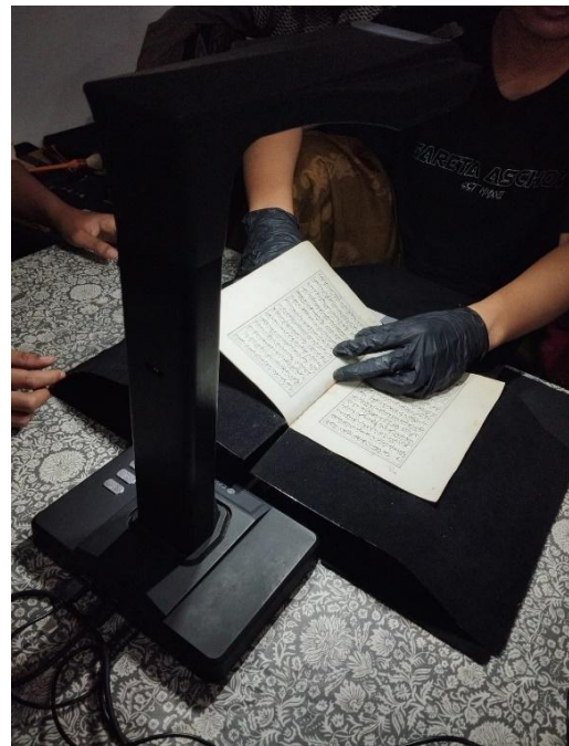
Gambar 1: Scriptorium/tempat penyimpanan naskah (kiri) dan proses digitalisasi (kanan)