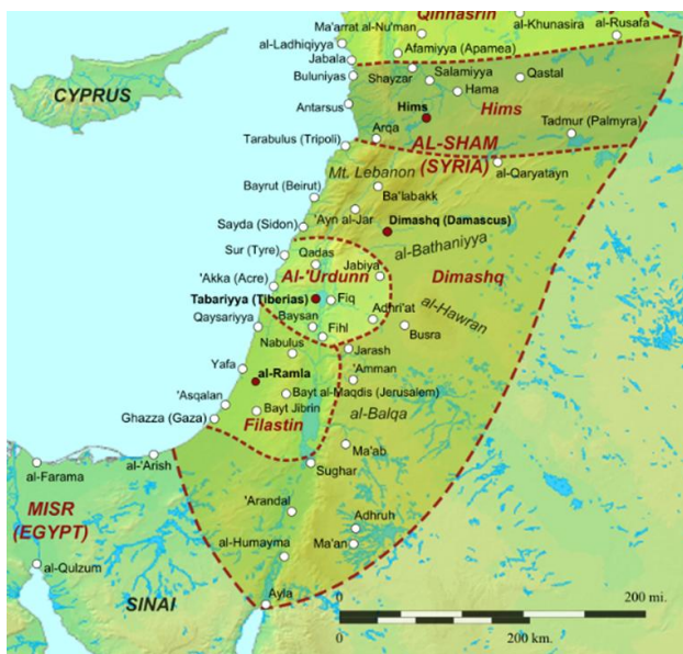
Gambar 1: Peta Pembagian Jund di masa Umayyah.

Kota Akka/Acre di Palestina menjadi pangkalan armada laut Dinasti Umayyah. Menurut Kennedy, pangkalan ini kemudian dipindahkan ke Tyre di Libanon pada masa Khalifah Hisyam (723-741 M). Armada laut Dinasti Umayyah inilah yang terlibat konfrontasi dengan Kekaisaran Byzantium untuk merebut Konstantinopel, antara lain pada 674 dan 716-718 M ( Kennedy, 2020, hal.415-417 dan 422). Semua ini menjadi bukti pentingnya Wilayah Syam bagi Dinasti Umayyah, yang stabilitasnya terganggu saat pemberontakan Abdullah bin Zubair meluas ke sana.